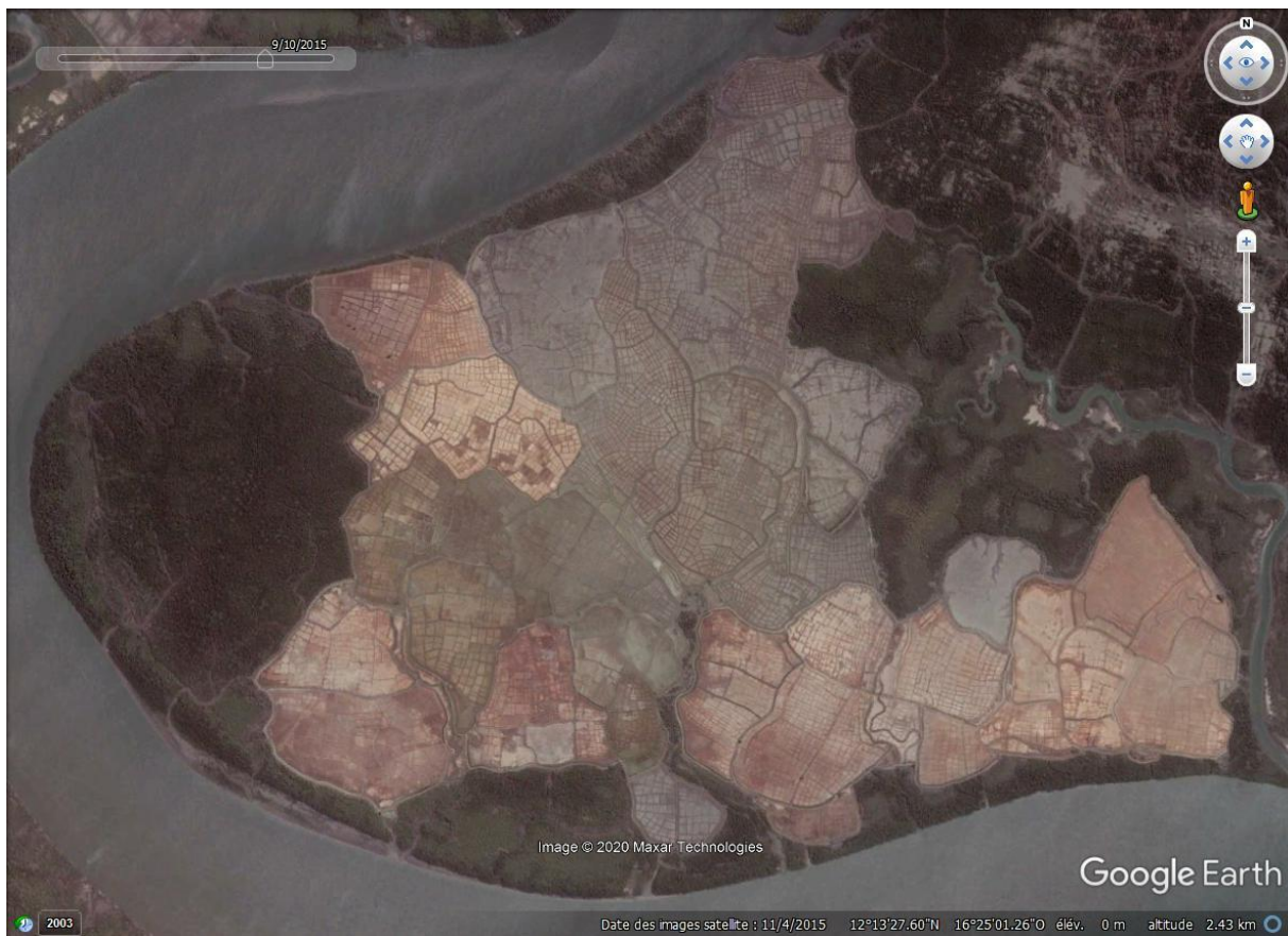
Ensemble de rizières abandonnées par le village d'Eosor représentant une surface potentielle de restauration.