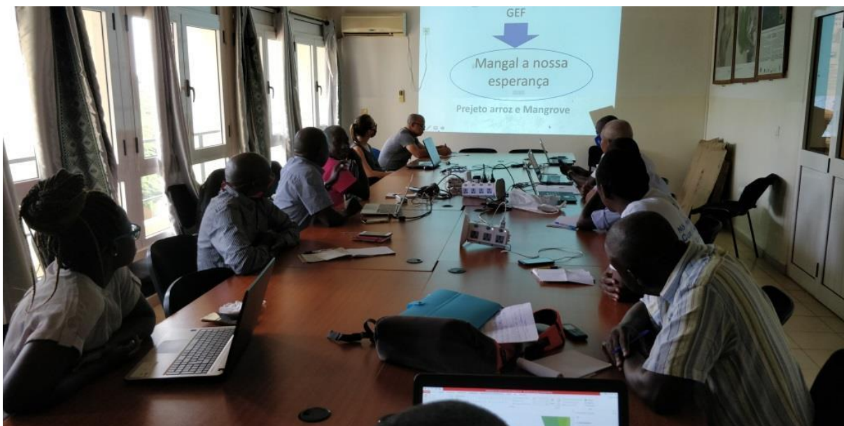
Réunion Bilan-Planification des activités réalisées avec les ONGs partenaires du TRI