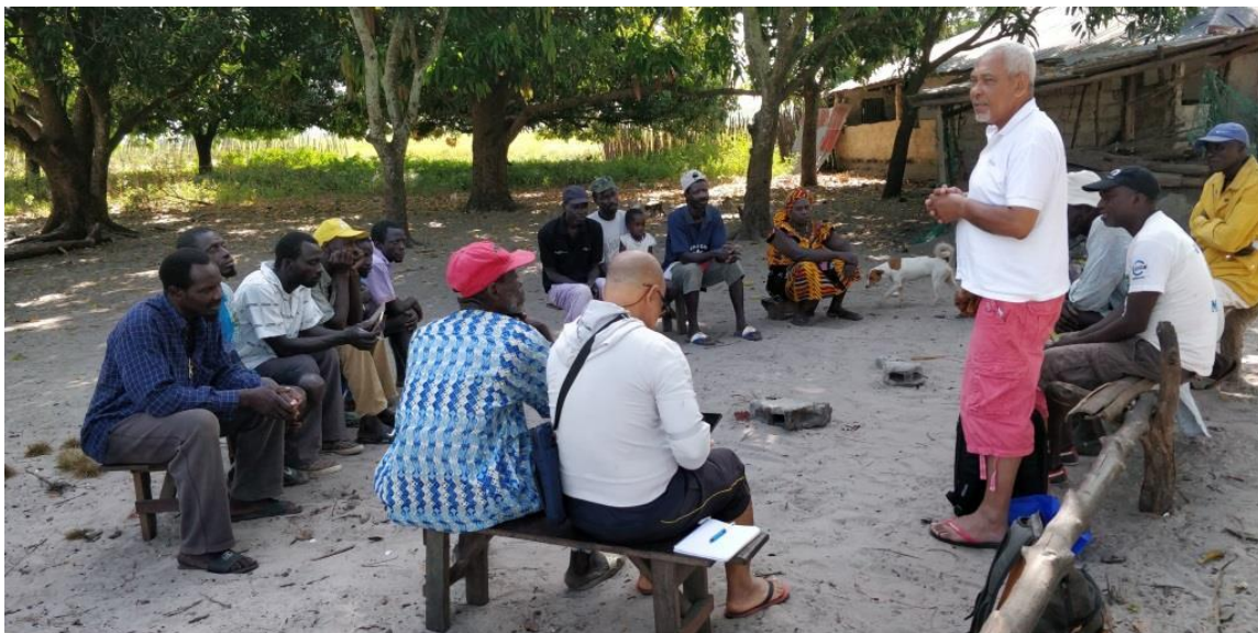
Réunion de concertation avec la communauté d'Elalab

Avec l'aval du Comité de pilotage, obtenu lors de sa dernière réunion, l'UGP a organisé une mission dans la région de Cacheu pour sonder l'intérêt des villages d'Elalab et Eossor qui disposent de surfaces de rizières abandonnées susceptibles d'être restaurées. La mission a obtenu l'accord de principe de ces deux nouveaux villages, accord qui fera l'objet d'un engagement formel prochainement.