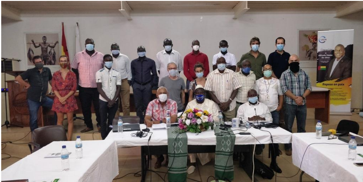
Participants de la journée d'échange sur les Paysages de mangroves de Guinée-Bissau

Les échanges ont ensuite permis de faire savoir ce que les différents projets souhaitent ou peuvent faire ensemble, tels que le développement de collaborations, de renforcements de capacités, de centralisation des informations et de coordination. La session suivante a permis de préciser ce que chacun des projets est en mesure d'apporter à la collectivité. La réflexion a porté ensuite sur les opportunités de pérenniser la plateforme. Il a été décidé à cet égard de créer un petit groupe de travail qui sera chargé de préciser les objectifs de la plateforme et de les décliner sous forme de termes de référence, avec la perspective d'institutionnaliser la plateforme à terme. La journée s'est achevée sur une étude de cas portant sur les diagnostics territoriaux participatifs, basé sur l'expérience du projet TRI.