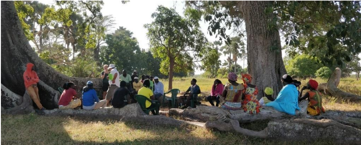
Présentation des objectifs de la rencontre et des principes du système de suivi-évaluation auprès des représentants de la communauté d'Elia.

Une fois le système élaboré l'UGP avec la consultante ont organisé, pendant 3 journées successives, une formation théorique des membres et partenaires du projet afin de les préparer à l'utilisation du système. Suite à cette phase théorique, une formation pratique a été réalisée sur le terrain. Une première mission a eu lieu dans la région de Cacheu dans le village d'Elia. Elle avait pour objectif de tester la validité du système en le confrontant aux réalités du terrain (le contenu des enquêtes est-il pertinent ? est-il bien dominé par les animateurs-enquêteurs ? est-il compréhensible de la part des villageois ?) tout en formant les enquêteurs à son usage. Une deuxième mission, avec les mêmes objectifs a par la suite été organisée en direction des villages de Quinara et Tombali.