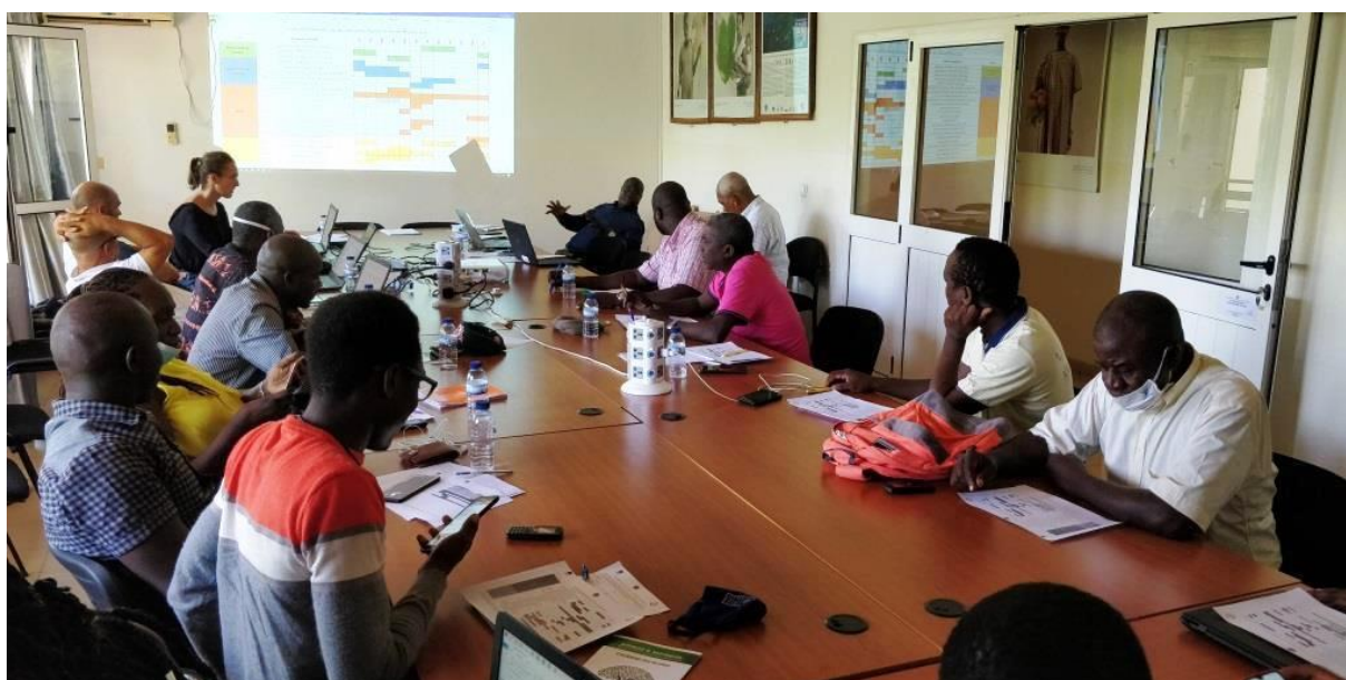
Formation théorique au Système de Suivi-Evaluation du projet

Pour la construction du Système de Suivi-Evaluation du projet une consultante internationale a été recrutée. Son travail a consisté tout d’abord à prendre connaissance du projet et de ses différentes composantes. Un ensemble de réunions a par la suite été organisé avec l’UGP pour définir le cadre global du système et les besoins consécutifs. A partir de ces éléments, la consultante a préparé un draft de système qui a été soumis à l’attention de l’UGP au fur et à mesure de son élaboration.