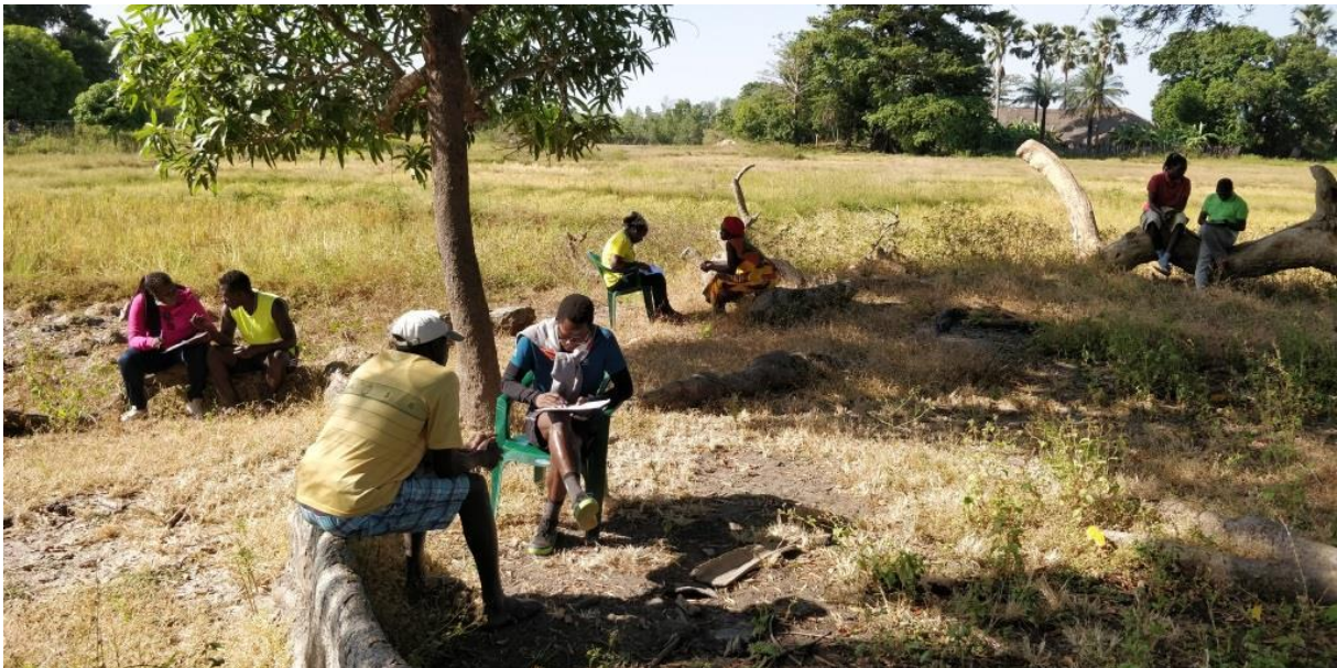
Enquêtes sur les différentes activités génératrices de revenus